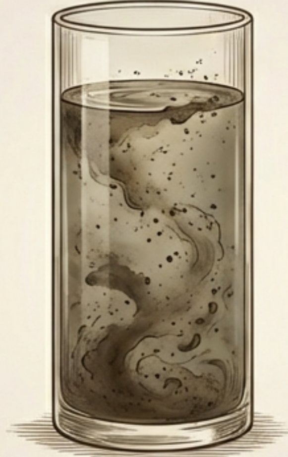
عقائد النواصب (القلب الملوث)

من يحمل عقائد هجينة (أشاعرة/معتزلة) ويدعي التشيع.