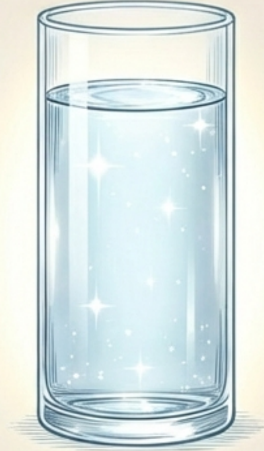
تعاليم العترة (القلب السليم)

طاهر من الشك، الغل، ومن "طفاسة" النواصب ومناهجهم.