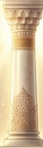
حرم الله: المسجد الحرام.

الاستنتاج المفصلي: بيت المقدس منزل مبارك للأنبياء، لكنه لا تُشدُّ إليه الرحال في ثقافة الكتاب والعترة. الإمام السجاد (صلوات الله عليه) شد الرحال إلى الكوفة وكربلاء في أحلك الظروف ولم يقصد بيت المقدس.