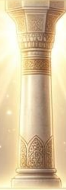
حرم رسوله: المسجد النبوي.