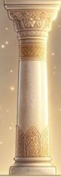
حرم الحسين: في كربلاء.