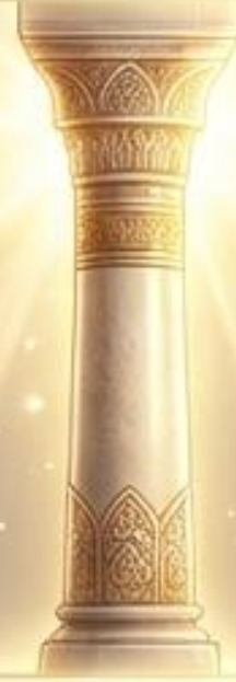
حرم أمير المؤمنين: مسجد الكوفة (وهو أفضل من بيت المقدس).