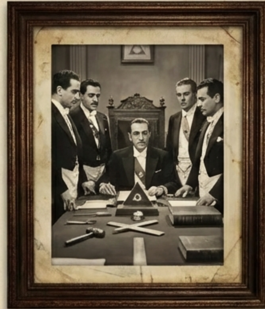
نجوم السينما (محمود المليجي، كمال الشناوي، أنور وجدي) في المحفل.

كانت الماسونية ترفع شعار 'الإنسانية' مما جذب النخبة، وهذا هو الجو الذي تسربت منه الأفكار إلى 'الإخوان' دون رابط تنظيمي مباشر.