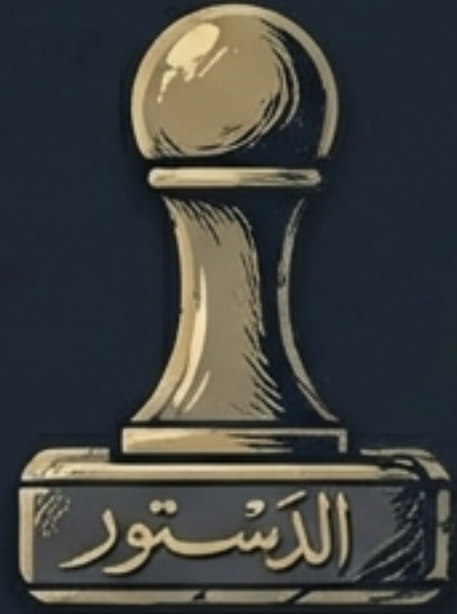
The Constitution (Al-Dastur)